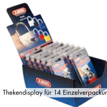
Thekendisplay für 14 Einzelverpackungen

Verkaufsfördernde Artikel sind wichtig für den Abverkauf ihrer Produkte. Sie unterstützen bei der Präsentation und schaffen Zusatzplatzierungen an verkaufsstarken Stellen.