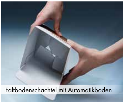
Faltbodenschachtel mit Automatikboden