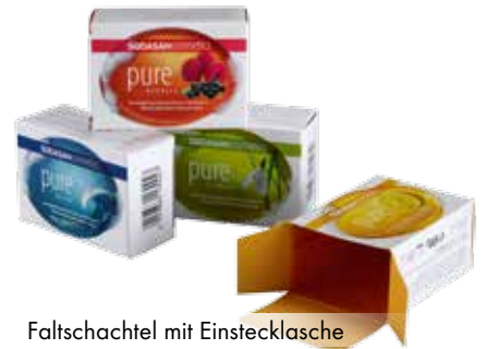
Faltschachtel mit Einsteckglasche

Eine Vielfalt unterschiedlicher Faltschachtelkonstruktionen ist möglich. Wir helfen Ihnen gerne bei der richtigen Wahl für Ihr Produkt. Ob Faltschachteln mit Automatikboden, Faltschachteln mit Einsteckverschluss oder Steckbodenschachteln. Sie bestechen durch Design, Form und Farbe, sind aber ebenso funktional und auffällig.