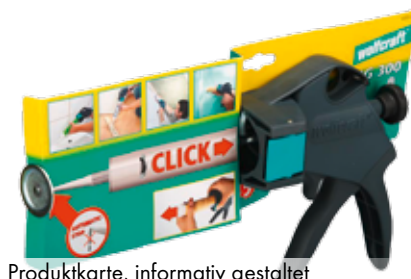
Produktkarte, informativ gestaltet

Eine wesentliche Eigenschaft des Kartons ist seine Flexibilität. Sehr viele Formen und Gestaltungsvarianten sind möglich. Immer unter Berücksichtigung der Anwendung und der optimalen Kommunikation am POS. Daher werden oftmals Sonderlösungen für eine Produktverpackung entwickelt und kostengünstig in Serie produziert.