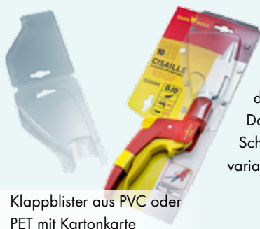
Klappblister aus PVC oder PET mit Kartonkarte

◀ Blisterkarten mit PVC-/PET-Haube und Heißfolienprägung