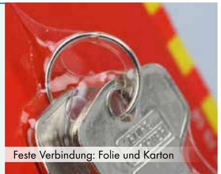
Feste Verbindung: Folie und Karton

Das Produkt wird auf dem Skinkarton maschinell mit einer PE-Skinfolie fest umschlossen. Sie verbindet sich im Abpackprozess mit dem Karton. Skinverpackungen erschweren Diebstahl und Beschädigung und schützen vor Staub, Feuchtigkeit und Handschweiß. Mit einer Eurolochausstattung ist das Produkt fertig für den Verkauf im Handel.