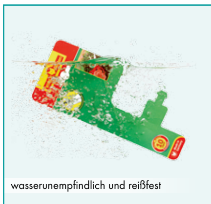
wasserunempfindlich und reißfest