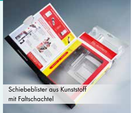
Schiebeblister aus Kunststoff mit Faltschachtel

Die klassische Ausführung einer Blisterverpackung ist die Kombination aus Kartonkarte + Kunststoffhaube. Darüber hinaus gibt es noch weitere Möglichkeiten wie Schiebe- oder Klappblisterverpackungen. Eine Einstoffvariante, Haube und Karte aus Karton, ist ebenfalls möglich.