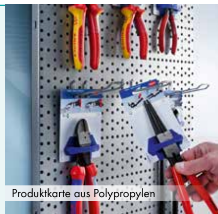
Produktkarte aus Polypropylen

Die ideale Möglichkeit Produkte auch dort zu verkaufen, wo es schon mal nass werden kann. Die Verpackung besteht aus Polypropylen-Folie. Diese ist bedruckbar wie Karton und unempfindlich bei Wasserkontakt. Hiermit sind auch zusätzliche Produktplatzierungen z. B. im Außenbereich von Garten-Märkten möglich. Polypropylen ist hoch reißfest und erschwert darüber hinaus einen potentiellen Diebstahl.