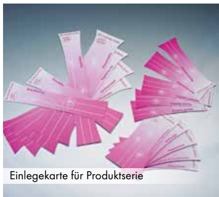
Einlegekarte für Produktserie